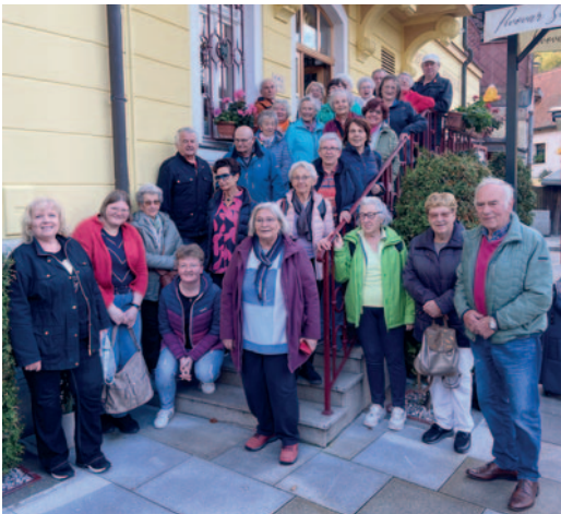
Fünf-Tages-Fahrt mit dem Reisebus: Tschechisches Bäder-Dreieck und Prag.

Für unsere älteren Mitbürger ist das Seniorenzentrum in der Gilchinger Straße ein beliebter Treffpunkt. In den gemütlichen, in Eigenleistung eingerichteten Räumen finden regelmäßig Kaffeenachmittage statt. Fasnachtsball im Bürgerhaus, Fischessen, Osterbrunch, Oktoberfest, Sommer-Grillfest oder Kürbisfest sind nur einige Höhepunkte des Jahres! Das umfangreiche Programm wird durch Vorträge, wie zum Beispiel zur Gesundheitsvorsorge oder Pflegeproblematik, ergänzt.