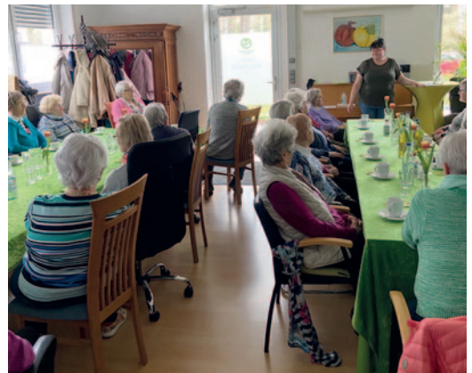
Für jeden interessant: Vortrag im Seniorenzentrum „Die Haut im Alter“.

Zur Entlastung pflegender Angehöriger bieten wir nach Bedarf eine Demenzgruppe oder stundenweise Betreuung von Demenzerkrankten zu Hause an. Auch Hilfe im Haushalt, Arztfahrten oder Besorgungen können in Notsituationen übernommen werden.