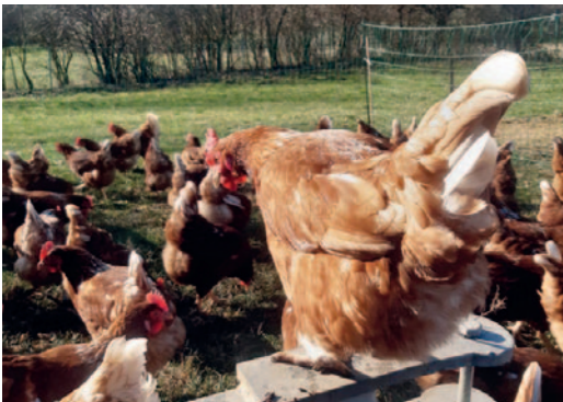
Glückliche Hühner auf der Wiese.

Wer einen Gemüsegarten pflegt, weiß: Nichts ist schöner, als die Früchte der eigenen Arbeit zu ernten und zuzubereiten. Ähnlich ist es, wenn Sie entlang der Felder radeln, auf denen „Ihre“ Kartoffeln gedeihen, oder wenn Sie den glücklichen Hühnern auf der Wiese zusehen, die „Ihre“ frischen Eier legen. Sie wissen, woher Ihre Lebensmittel kommen und kennen die Menschen, die mit Herzblut und Hingabe mit ihrer täglichen Arbeit hinter diesen Lebensmitteln stehen.