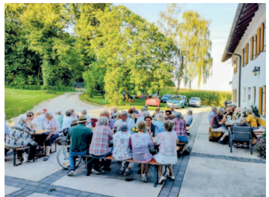
Sommerfest – Grillen am Stenzer-Hof.