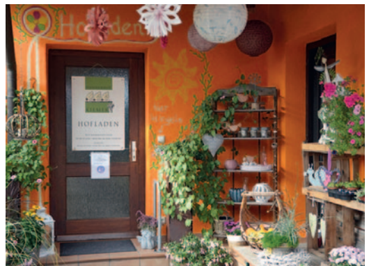
Neben Eiern, Nudeln, frischen Backwaren und köstlichen Kuchen gibt es vielerlei schöne Dinge bei Kiemers.