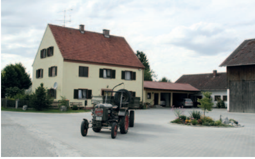
Lipphof – die letzte Milchwirtschaft im Ort.