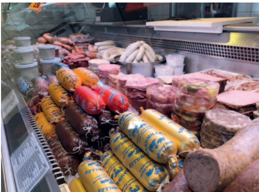
Eine große Auswahl an Fleisch und Wurst aus eigener Produktion in Braumillers Hofmetzgerei.