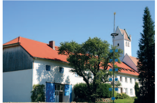
Die Votivkapelle von Hoflach trägt den Namen St. Maria und Georg. Sie steht auf privatem Grund und kann nur zu bestimmten Zeiten besichtigt werden.

dar. Sie wurde vor einigen Jahren aufwendig restauriert und instandgesetzt. Im Jahr 2022 wurde das 600. Jubiläum der Schlacht mit einer historischen Ausstellung, und fortgesetzt im Jahr 2023 mit einem großen Mittelalterfest gefeiert.