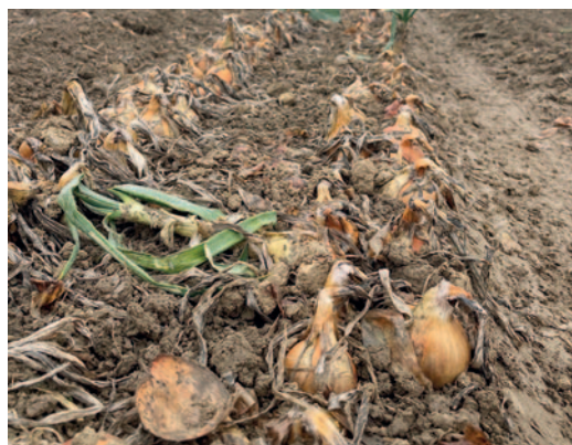
Saftige, große Zwiebeln wachsen auf Allinger Feldern

Holzhausen 2, Alling Eier von freilaufenden Hühnern, Milch, Joghurt, Grießbrei, Lidl-Bauernhofeis, Nudeln aus eigenen Eiern, Kartoffeln und Zwiebeln zur Erntezeit (aus Gagers) SB-Rund um die Uhr