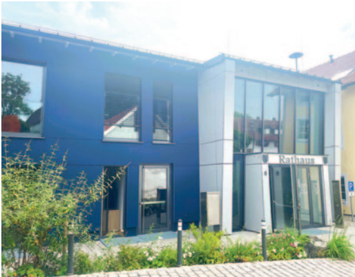
Das Rathaus auf dem Kirchberg mit modernem Bürgerservice.

Idyllischer Weiler mit herrlicher Aussicht, zwischen Germannsberg und Biburg. Früher war das Anwesen ein Wirtschaftshof des Klosters Fürstentfeld. Heute gibt es dort eine