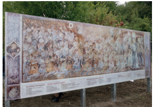
Zum 600. Jubiläum der Schlacht bei Hoflach wurde dieses Abbild des Freskos aus der Kapelle, mit detaillierter Beschreibung, entlang des Radweges aufgestellt.