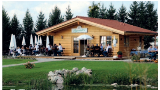
Auf der Terrasse der „Angerhütte“ kann man Kuchen oder eine Brotzeit bei herrlicher Aussicht genießen.