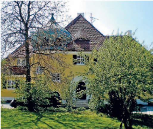
Diese Villa war in den 50er Jahren ein Kindererholungsheim.