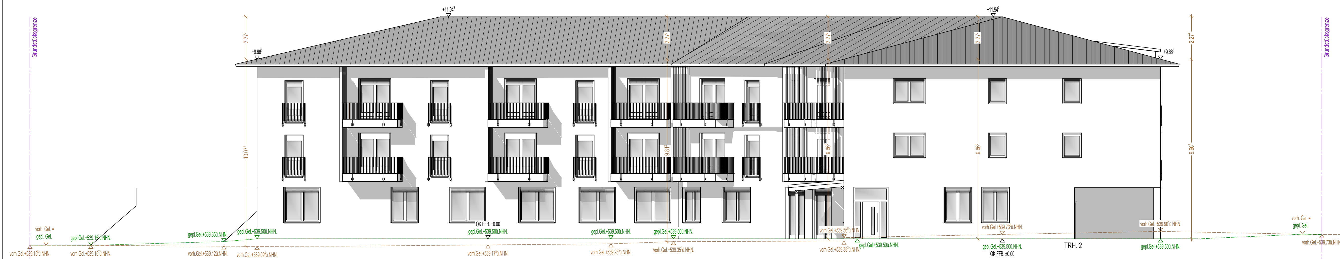
Ansicht Südwest Gebäude 1