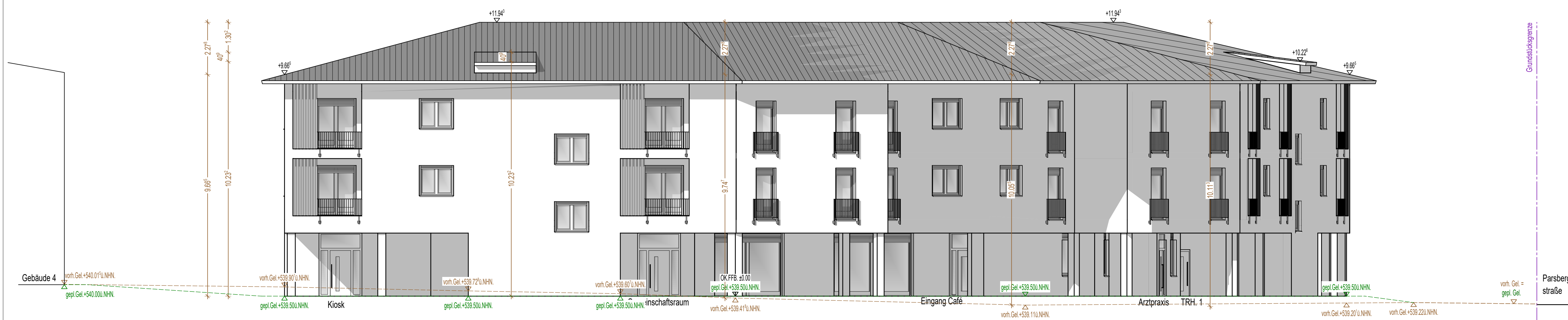
Ansicht Südost Gebäude 1