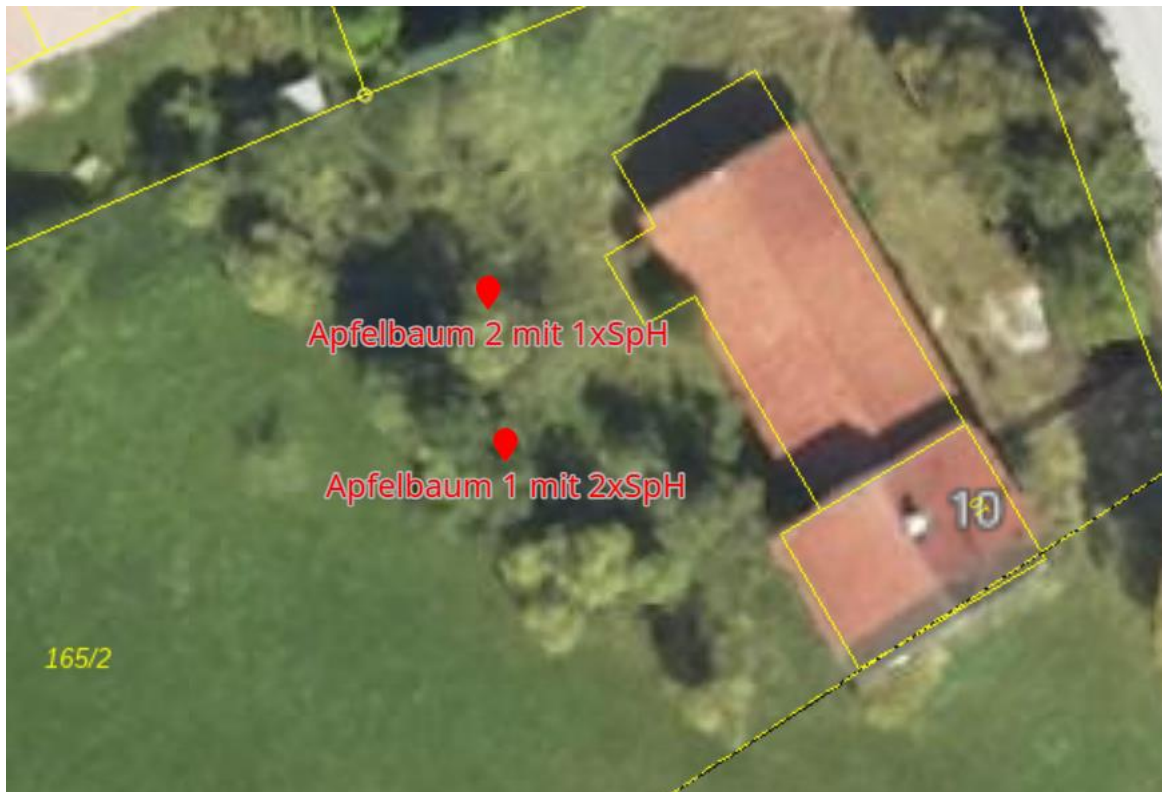
Abb. 17: Luftbild mit Standorten der Apfelbäume mit den Spechthöhlen (SpH), das Gebäude wurde bereits abgerissen.

Weitere potenzielle Fledermaushabitate kommen im UG nicht vor.