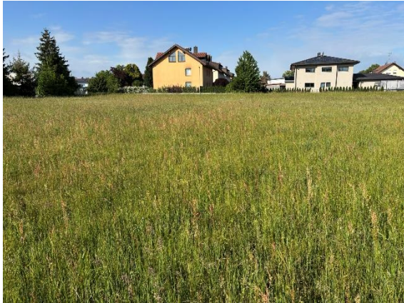
Abb. 3: Wiese im UG