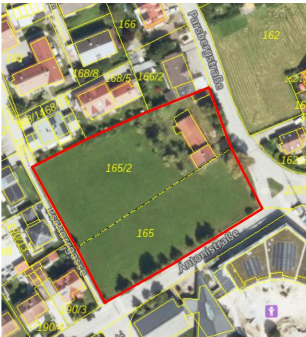
Abb. 2: Orthophoto des Untersuchungsgebiets, das Gebäude wurde bereits abgerissen.

Das Planungsgebiet umfasst das in Abb. 2 rot umrandeten Gebiet. Es umfasst die Grundstücke Fl. Nrn. 165 und 165/2, Gemarkung Alling, und hat eine Fläche von ca. 6.800 m 2 . Das Grundstück fällt von Westen nach Osten um ca. 0,9 m ab und von Süden nach Norden um ca. 1,2 m. Das Grundstück ist derzeit unbebaut, lediglich im Nordosten befand sich ein Gebäude, welches jedoch bereits abgerissen wurde. Auf dieser Fläche befindet sich nun Erdmaterial sowie Bauschutt. Der Großteil des Grundstücks ist eine Wiesenfläche, die gehölzfrei ist. Im Nordosten im nahen Bereich des ehemaligen Gebäudes befinden sich mittelalte bis alte Gehölze, mit Obstbäumen, wie Apfel, Schlehe, Zwetschge, Kirsche sowie Holunder und Pfaffenhütchen. An der (nord-)östlichen Grundstücksgrenze entlang der Parsbergstraße befinden sich vier Bäume alter Ausprägung, zwei Linden und zwei Kastanien. Entlang der Südgrenze an der Antonistraße befinden sich ebenfalls Gehölzgruppen mit mittelalten Fichten sowie jungen Eschen, Kirsche, Feldahorn und Hartriegel.