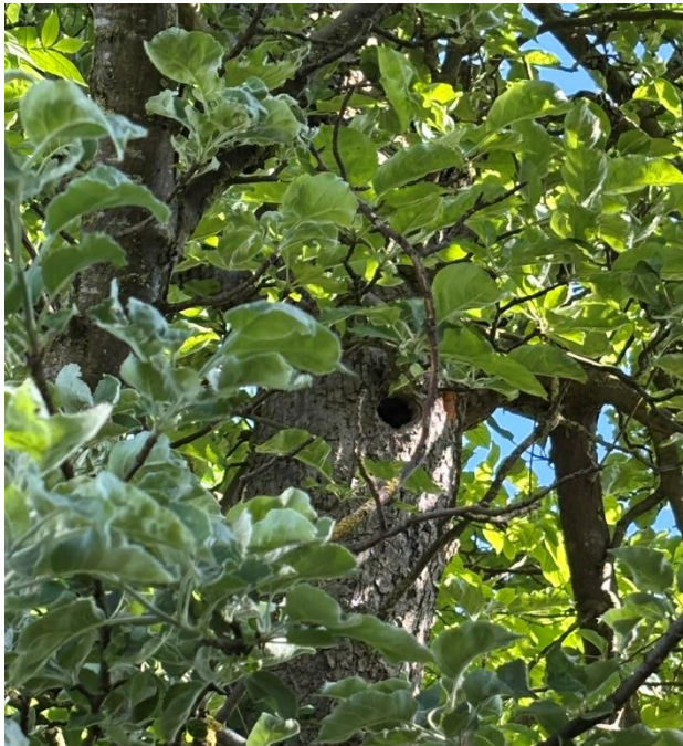
Abb. 14: Nach Süden gerichtete Spechthöhle am Apfelbaum Nr. 1

Fällung durch eine fledermausfachkundige Person zu untersuchen ( V1 ). Bei einem Vorkommen von Fledermäusen sind notwendige Maßnahmen durch die fledermausfachkundige Person durchzuführen. Bei keinem Fledermausvorkommen sind die Apfelbäume umgehend zu fällen oder die Spechtlöcher zu schließen, sodass diese nicht mehr für Fledermäuse zugänglich sind. Durch die Rodung der beiden Bäume gehen potenzielle Fledermaushabitate verloren. Deshalb sind 6 Fledermauskästen am Baumbestand innerhalb des bebauten Gebiets in Alling anzubringen ( V2 ). Der Torso des Apfelbaums mit den zwei Spechthöhlen (vgl. Abb. 17, Baum Nr. 1) ist als Totholz an einem anderen Baum in der Nähe des UGs anzubinden und dauerhaft zu erhalten ( V3 ).