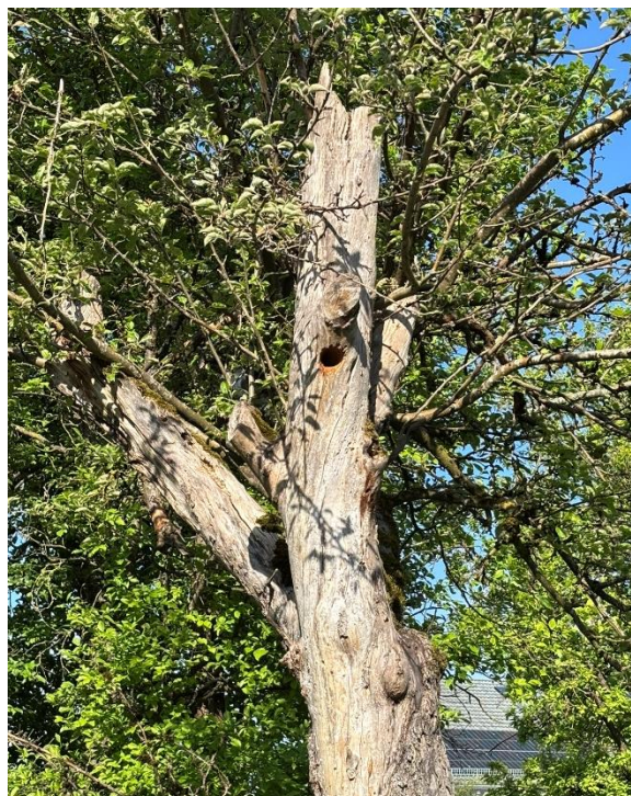
Abb. 16: Spechthöhle an Apfelbaum Nr. 2