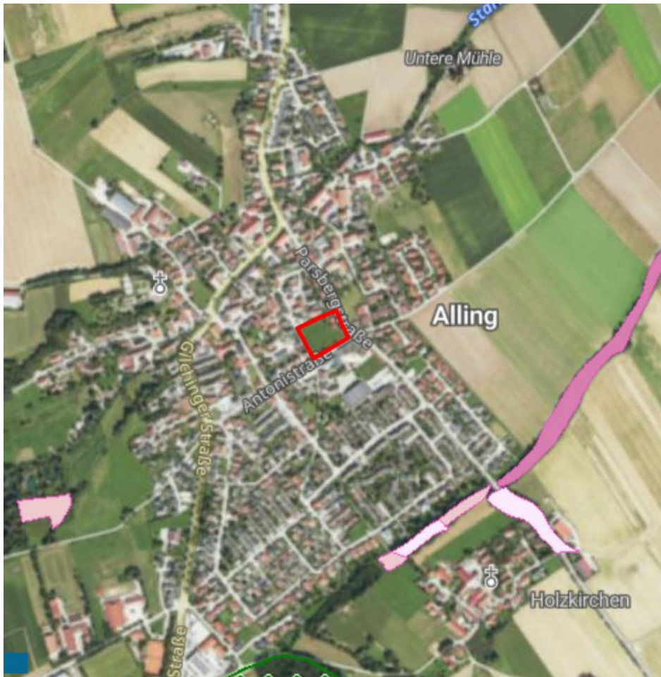
Abb. 13: Lage des UGs mit vorkommenden Schutzgebieten und amtlich kartierten Biotopen. Hellrosa = amtlich kartiertes Biotop, grüne Punkte = Landschaftsschutzgebiet

Das Grundstück befindet sich in keinem Schutzgebiet und auf dem Grundstück befindet sich auch kein amtlich kartiertes Biotop. Das nächstgelegene amtlich kartierte Biotop befindet sich erst in ca. 450 m Entfernung in südöstlicher Richtung. Das nächstgelegene Schutzgebiet ist ein Landschaftsschutzgebiet und befindet sich in ca. 700 m südlich des Planungsgebiets. Aufgrund der weiten Entfernung sind keine Schutzgebiete vom Bauvorhaben betroffen. ASK-Artnachweise gibt es in ca. 200 m südwestlicher und 300 m nordwestlicher Entfernung für Brutvögel und Fledermäuse. Durch die Umsetzung des Bauvorhabens sind Gefährdungen dieser jedoch nicht zu erwarten.