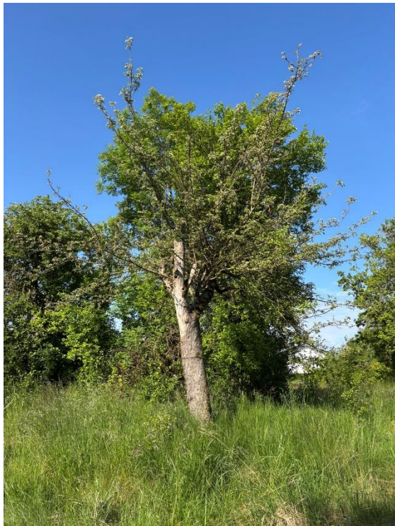
Abb. 7: Zu rodender Obstbaumbestand im Nordosten des UG