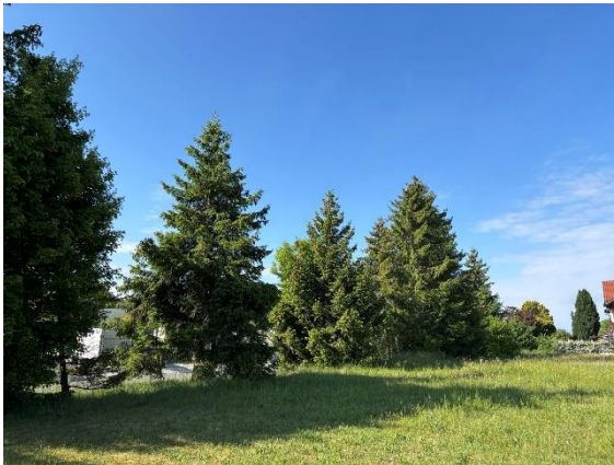
Abb. 11: Zu fällende Gehölzgruppen an der Südgrenze des UG