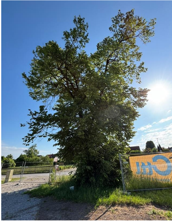
Abb. 9: Zu fällende Linde im Nordosten des UG