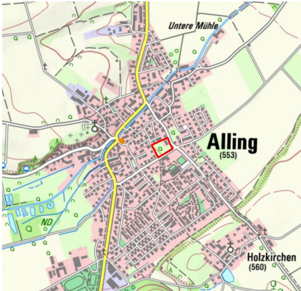
Abb. 1: Lage des Untersuchungsgebiets

Auf den Grundstücken Fl. Nrn. 165 und 165/2, Gmkg. Alling an der Ecke Parsbergstraße und Antonistraße in Alling ist ein Neubauprojekt geplant. Das Untersuchungsgebiet (UG) ist zurzeit un bebaut. Lediglich im nordöstlichen Teil war das Grundstück bebaut. Dieses wurde jedoch bereits abgerissen. Der nordöstliche Teil des Untersuchungsgebiets zeigt einen Baum- und Gehölzbestands mittleren bis hohen Alters. Randlich entlang der Antonistraße befinden sich ebenfalls Gehölzgruppen. Die restliche und der Großteil der Fläche ist eine Wiese. Für die Umsetzung des Bauvorhabens müssen die Gehölze, mit Ausnahme voraussichtlich einer Kastanie, auf dem Grundstück gerodet werden.