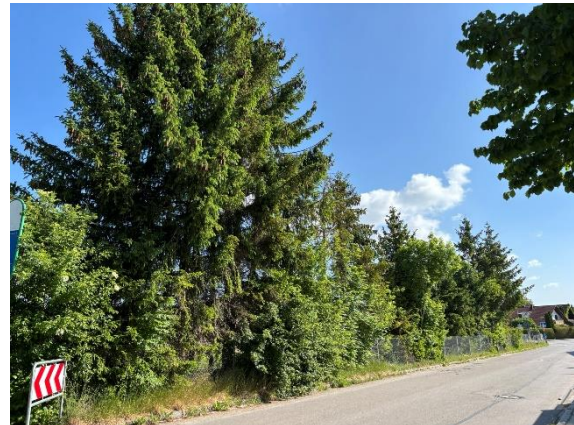
Abb. 12: Zu fällende Gehölzgruppen an der Südgrenze des UG von der Antonistraße aus