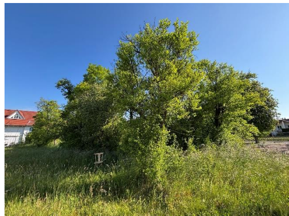
Abb. 6: Zu rodender Obstbaumbestand im Nord-osten des UG