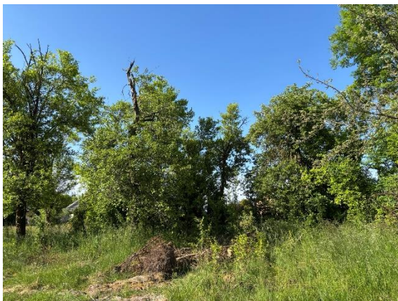
Abb. 5: Zu rodender Obstbaumbestand im Nordosten des UG