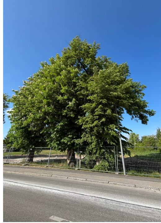
Abb. 10: Zu fällende Linde und Kastanie im Nordosten des UG von der Parsbergstraße aus