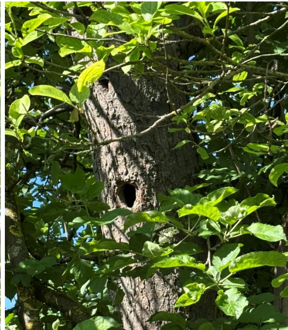
Abb. 15: Nach Westen gerichtete Spechthöhle am Apfelbaum Nr. 1