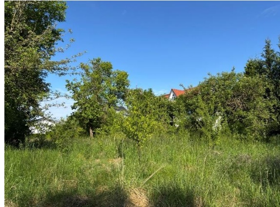
Abb. 4: Zu rodender Obstbaumbestand im Nord-osten des UG