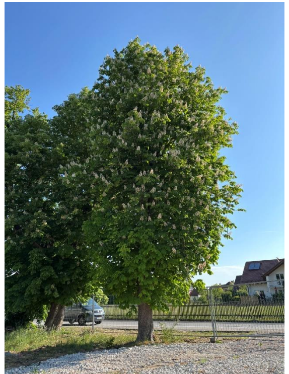
Abb. 8: Voraussichtlich zu erhaltende Kastanie im Nordosten des UG