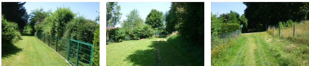
Fußweg entlang der Südwestgrenze des Geltungsbereiches

Auf der Südwestseite finden sich sehr unterschiedlich gestaltete Gärten. Südlich grenzen zwei Biotope an den Geltungsbereich an. Zwischen den Gärten und den Biotopen besteht ein öffentlicher Fußweg, der sowohl durch die Randbepflanzung der Gärten als auch durch die bewaldete Hangkante nach Holzkirchen üppig begrünt ist.