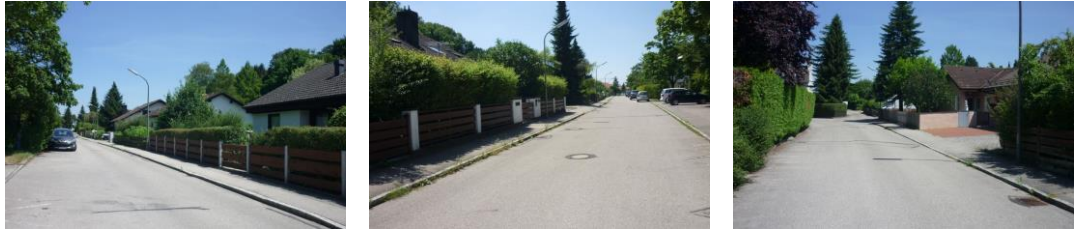
Vorgärten an der Roßfeldstraße und der Greppenstraße

Die Vorgärten wurden - soweit es der Platz zuließ - begrünt, so dass weitere Festsetzungen zur Grünordnung im Bebauungsplan nicht getroffen werden.