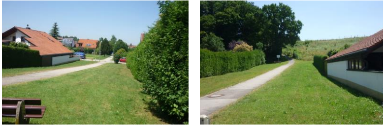
Fußweg von der Greppenstraße nach Holzkirchen

In dieser Grünfläche ist die Pflanzung von 4 Eichen vorgesehen zur gestalterischen Aufwertung und zur Beschattung des Weges.